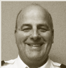
FONCTION PUBLIQUE FÉDÉRALE Louis Berberi Chef des opérations intérimaire Agence des services frontaliers du Canada